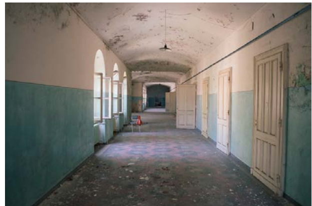
«Gli operatori potevano liberarsi del manicomio solo a patto di liberare i propri pazienti»

Varcando la soglia del CSM di Gorizia non si percepisce lo stesso orgoglio per l'utopia realizzata che invece anima gli operatori triestini. A differenza di Trieste, infatti, Gorizia è sempre stata una città di provincia, dove era difficile che le novità venissero accettate. Quando Franco Basaglia ripartì da Gorizia nel 1968, in seguito a un drammatico incidente – un paziente in permesso giornaliero tornò a casa e uccise la moglie –, la città per anni fece finta di non averlo ospitato. Il CSM si trova nel Parco Basaglia, il giardino dell'ex manicomio, il cui muro faceva parte di un pezzo del confine orientale che separava l'Italia dalla Jugoslavia. Il funzionamento della psichiatria goriziana, però, non è diverso da quella triestina. Porte aperte sulle 24 ore, otto posti letti quasi mai tutti occupati, ricoveri di massimo una settimana. Le persone seguite ogni anno sono circa 2000 e un centinaio entra ed esce ogni giorno. Una ventina sono pazienti fissi, altri sono completamente invisibili. Molti di loro vengono per il pranzo, che costa 50 centesimi simbolici da usare a fine mese per andare tutti a cena fuori.