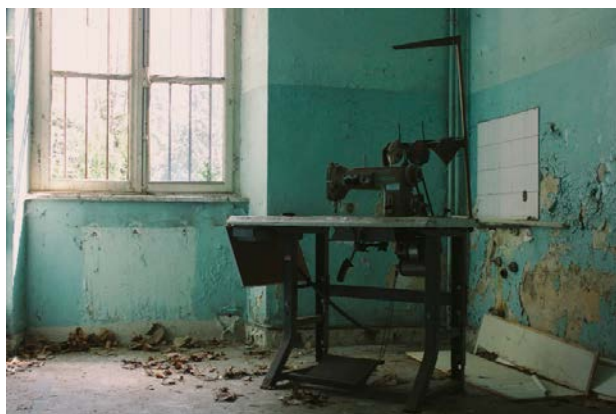
«La follia non viene mai ascoltata per ciò che dice o che vorrebbe dire»

La realtà della Maddalena è molto simile a quella di quasi tutti i CSM del Friuli-Venezia Giulia, dove l'attuazione della legge 180, non senza difficoltà, ha dimostrato che le intuizioni di Basaglia e dei suoi collaboratori possono essere realizzate. È stata una rivoluzione vissuta dall'intera città, dai cittadini, e forse anche per questo oggi la legge 180 qui è