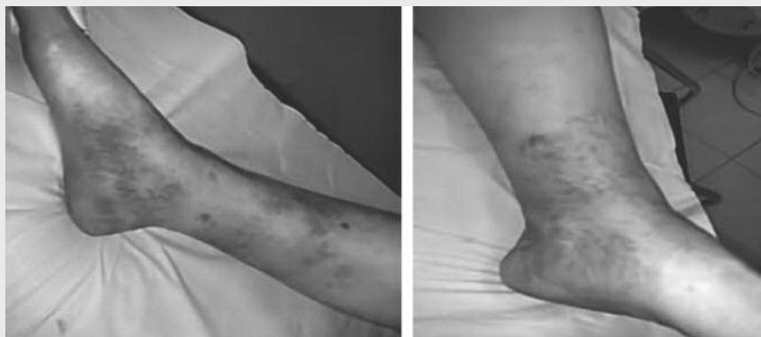
Figura 1. Foto arto inferiore di paziente con IVC in cui si possono osservare le caratteristiche manifestazioni cliniche della malattia: teleangectasie, vene reticolari, dilatazione venosa, edema e fibrosi cutanea.

I risultati venivano comparati con 32 pazienti (gruppo B), omogenei per sesso ed età, giunti consecutivamente e giudicati sani per l'assenza di segni clinici e di storia di malattia venosa (tabelle 1 e 2).