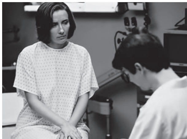
Figura 4. Emma Thompson in Wit , di Mike Nichols (2001), uno dei più bei film dedicati alla questione-cancro.

Uno dei momenti cruciali della trattazione cinematografica della malattia oncologica è co-