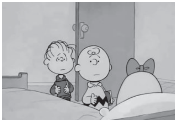
Figura 1. Fotogramma di un episodio dei Peanuts: Why, Charlie Brown, Why? , in TV nel 1990.

Obiiettivo di questo lavoro è mettere in luce qual è l'immagine prevalente del tumore sul grande schermo; quali ne sono i protagonisti e quali caratteristiche incarnano; quali sono i tumori più rappresentati, come viene narrata la loro diagnosi e qual è la loro prognosi; quali registi, di quali Paesi e a quale scopo se ne sono occupati, nonché il potenziale educativo di molte di queste pellicole (il ruolo della cosiddetta cinemedication ) 4 .