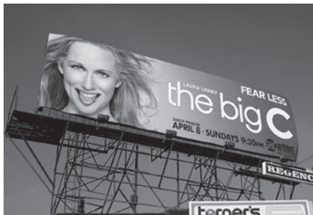
Figura 2. The Big C è andato in onda dal 2010 al 2013 in 40 puntate televisive.

A tal fine, si è fatto ricorso alla letteratura 5-10 , ai principali database internazionali (come Allmovie, IMDb, Movieplayer, Mymovies, listal), a ricerche mirate su Medline/PubMed e Google ("movies about cancer", "cancer or tumor and/or in movies", "cancer-themed movies"), alle risorse web specializzate ed ai blog di terapeuti e pazienti, rintracciando e prendendo in considerazione il maggior numero possibile di film destinati al circuito cinematografico che ne hanno trattato, prodotti dagli anni Trenta del Novecento ad oggi. Una diversa ricerca è in corso sulla presenza del cancro nelle serie televisive (come il recente The Big C ) (figura 2), negli sceneggiati e nei film realizzati per la TV.