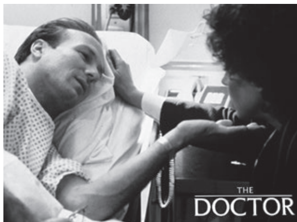
Figura 6. Locandina del film The Doctor , uscito in Italia con il titolo Un medico, un uomo (R. Haines 1991).

chia familiare ( Nemiche amiche , L'ultimo sogno , La neve nel cuore , Big fish , Schegge di April , La custode di mia sorella ), o ancora, e più raramente, di una piccola comunità, magari sportiva (come in Batte il tamburo lentamente e in L'ultima cor-