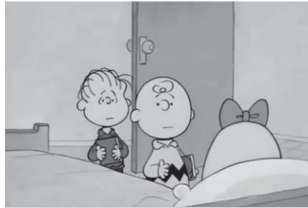
Figura 1. Fotogramma di un episodio dei Peanuts: Why, Charlie Brown, Why? , in TV nel 1990.

Obiiettivo di questo lavoro è mettere in luce qual è l'immagine prevalente del tumore sul grande schermo; quali ne sono i protagonisti e quali caratteristiche incarnano; quali sono i tumori più rappresentati, come viene narrata la loro diagnosi e qual è la loro prognosi; quali registi, di quali Paesi e a quale scopo se ne sono occupati, nonché il potenziale educativo di molte di queste pellicole (il ruolo della cosiddetta cinemedication ) 4 .