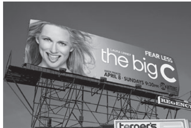
Figura 2. The Big C è andato in onda dal 2010 al 2013 in 40 puntate televisive.

A tal fine, si è fatto ricorso alla letteratura 5-10 , ai principali database internazionali (come Allmovie, IMDb, Movieplayer, Mymovies, listal), a ricerche mirate su Medline/PubMed e Google ("movies about cancer", "cancer or tumor and/or in movies", "cancer-themed movies"), alle risorse web specializzate ed ai blog di terapeuti e pazienti, rintracciando e prendendo in considerazione il maggior numero possibile di film destinati al circuito cinematografico che ne hanno trattato, prodotti dagli anni Trenta del Novecento ad oggi. Una diversa ricerca è in corso sulla presenza del cancro nelle serie televisive (come il recente The Big C ) (figura 2), negli sceneggiati e nei film realizzati per la TV.