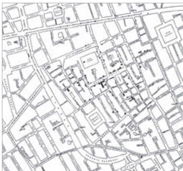
Figura 2. Quando seppe dell'epidemia di Broad Street, nella Londra del 1854, John Snow si precipitò nella zona di Golden Square. Se la sua teoria era giusta, l'unico legame fra la nuova e le precedenti epidemie avrebbe dovuto essere l'acqua contaminata. Iniziò le indagini porta a porta, rintracciando anche gli abitanti originali che erano fuggiti dalla zona e quelli che erano stati ricoverati nelle case dei poveri e negli ospedali. Attraversò la zona centinaia di volte e riuscì a pubblicare una cartina abbastanza accurata con una forte indicazione visiva di una relazione diretta fra la vicinanza al pozzo-pompa e la mortalità dei residenti. Una volta che questa famosa epidemia passò lo zenit (questo avvenne principalmente per il rarefarsi della popolazione che era morta o fuggita più che per la rimozione della manovella della pompa), Snow analizzò i suoi dati, scrisse la relazione e poi la pubblicò a spese sue. Fu abile a capire il significato di coloro che si erano ammalati e che erano morti, ma soprattutto il significato straordinario delle eccezioni, di coloro cioè che non si ammalarono (come i birrai che bevevano solo birra) o dei non residenti che erano morti, come la vedova di Hampstead, l'ufficiale dell'esercito ed il gentiluomo di Brighton il cui unico nesso con Broad Street era l'acqua 2 .

punti salienti. Naturalmente, la visualizzazione online rimanderà sempre al documento originale in modo che il lettore possa avere accesso a tutte le altre informazioni che volesse approfondire; • essere contestualizzata, anche senza avere la pretesa di parlare a tutti i tipi di pubblico; • e naturalmente avere stile e leggibilità. Un esempio a sostegno di quest'ultimo punto tratto dal lavoro al New Scientist può essere facilmente visualizzato dopo una ricerca su web: l'infografica Cancer disconnect mostra la sproporzione tra i fondi destinati alla ricerca per la terapia del tumore del polmone e il numero di morti che questo provoca, rispetto ad altre patologie oncologiche (ad esempio, la leucemia). Per arrivare a questo risultato, siamo partiti da una "tavolozza" elettronica che offre gli strumenti di base per muoversi in libertà: pochi colori, testo essenziale.