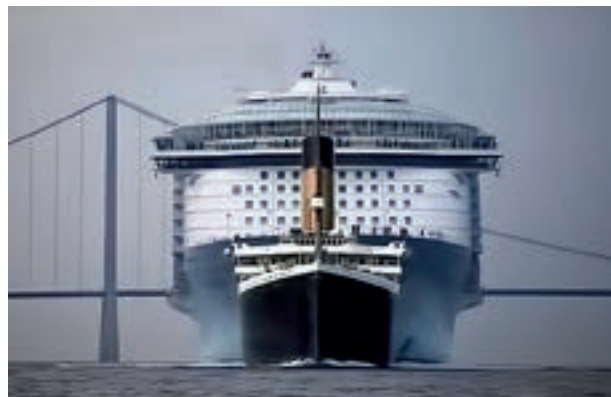
Immagine postata su Twitter da James A. Sexton.