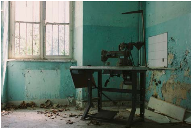
«La follia non viene mai ascoltata per ciò che dice o che vorrebbe dire»

La realtà della Maddalena è molto simile a quella di quasi tutti i CSM del Friuli-Venezia Giulia, dove l'attuazione della legge 180, non senza difficoltà, ha dimostrato che le intuizioni di Basaglia e dei suoi collaboratori possono essere realizzate. È stata una rivoluzione vissuta dall'intera città, dai cittadini, e forse anche per questo oggi la legge 180 qui è