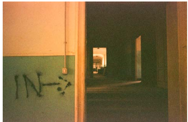
«Abbiamo dimostrato che l'impossibile può diventare possibile»

"L'incontro con Basaglia mi ha cambiato la vita", mi dice. Era la primavera del 1971 e Dell'Acqua era interno nella clinica neurologica di Napoli. Aveva sentito parlare di Basaglia grazie a uno dei suoi libri più famosi, L'istituzione negata 1 . Non era ancora consapevole della portata innovativa del lavoro di Basaglia, ma colse qualcosa che lo spinse a volerlo incontrare ancora prima della laurea. Così andò a Parma, dove Basaglia lavorava nel manicomio di Colorno. "Fu la prima volta che entrai in un manicomio. Mi sono trovato nel camerone dei cronici: uno che cantava, l'odore del sudore e dell'urina che poi ho imparato a riconoscere, il rumore delle voci che si accalcano. È venuta a prendermi la moglie di un medico che lavorava lì, una bellissima ragazza francese. Uno ha tirato fuori dalla tasca una caramella e gliel'ha offerta, lei l'ha scartata e se l'è messa in bocca. Io stavo per dare di stomaco". L'ha seguita e dopo