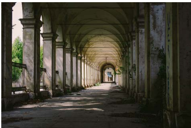
«Nel manicomio il malato non trova altro che il luogo dove sarà definitivamente perduto»