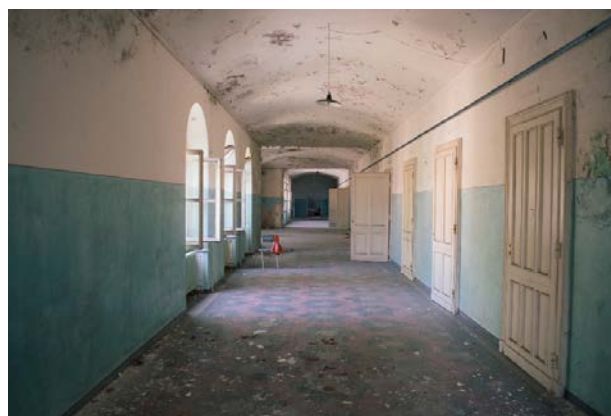
«Gli operatori potevano liberarsi del manicomio solo a patto di liberare i propri pazienti»

Varcando la soglia del CSM di Gorizia non si percepisce lo stesso orgoglio per l'utopia realizzata che invece anima gli operatori triestini. A differenza di Trieste, infatti, Gorizia è sempre stata una città di provincia, dove era difficile che le novità venissero accettate. Quando Franco Basaglia ripartì da Gorizia nel 1968, in seguito a un drammatico incidente – un paziente in permesso giornaliero tornò a casa e uccise la moglie –, la città per anni fece finta di non averlo ospitato. Il CSM si trova nel Parco Basaglia, il giardino dell'ex manicomio, il cui muro faceva parte di un pezzo del confine orientale che separava l'Italia dalla Jugoslavia. Il funzionamento della psichiatria goriziana, però, non è diverso da quella triestina. Porte aperte sulle 24 ore, otto posti letti quasi mai tutti occupati, ricoveri di massimo una settimana. Le persone seguite ogni anno sono circa 2000 e un centinaio entra ed esce ogni giorno. Una ventina sono pazienti fissi, altri sono completamente invisibili. Molti di loro vengono per il pranzo, che costa 50 centesimi simbolici da usare a fine mese per andare tutti a cena fuori.