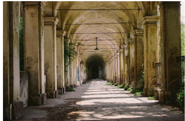
«Quando qualcuno è folle ed entra in un manicomio, smette di essere folle per trasformarsi in malato»