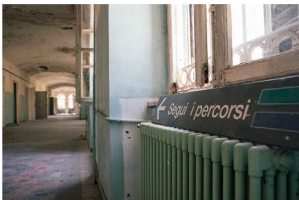
«La società, per dirsi civile, dovrebbe accettare tanto la ragione quanto la follia»

sono le principali patologie e le differenze legate al genere. Se i tassi relativi ai disturbi schizofrenici, ai disturbi di personalità, di abuso da alcol e sostanze e al ritardo mentale sono infatti maggiori nel sesso maschile, le donne, che sono il 54% dei pazienti, soffrono maggiormente di disturbi affettivi, nevrotici e depressivi. E le risorse disponibili non bastano per assisterli: nei CSM, centri diurni e strutture residenziali, lavorano 31.586 dipendenti. Rispetto all'anno precedente si è registrato un passo in avanti, ma siamo ancora lontani dallo standard individuato dal Progetto Obiettivo del 1999 5 , che prevedrebbe come minimo 66,6 operatori ogni 100 mila abitanti. "C'è una grave carenza anche di fondi", continua Starace. "Quando si è abbattuta la scure dei tagli in sanità la salute mentale è stata fortemente penalizzata perché viene considerata un corpo aggiunto del quale poco o nulla si sapeva e si sa tutt'ora. Basta pensare che nel 2001 la Conferenza delle Regioni aveva stabilito che venisse destinato alla salute mentale il 5% della spesa sanitaria, ma lo fanno solo Trentino-Alto Adige ed Emilia-Romagna".