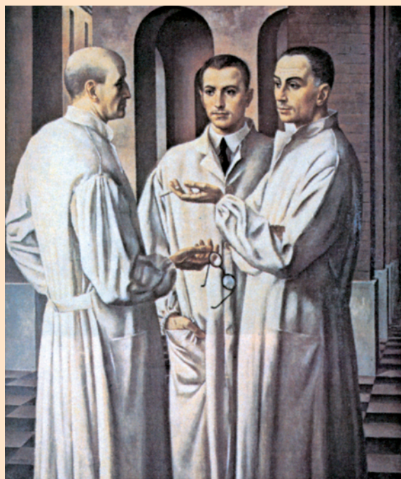
Ubaldo Oppi: Les trois chirurgiens, 1926

Capitoli di anatomia sono distribuiti in tutto il libro ed a ognuno segue un commento conclusivo di un Curatore. Nyhus e Baker, che firmano questi commenti, si promettono di sottolineare, in essi, i passaggi più importanti dei diversi capitoli ed aggiungervi alcune notazioni provocatorie («contrapuntual reviews») senza, per questo, criticare o rifiutare il punto di vista dell'Autore. Tale particolarità – che è di notevole forza metodologica e culturale – è stata ancor più valorizzata nella presente (quinta) edizione, arricchita da contributi nuovi sulla chirurgia epato-biliare, laparoscopica, endovascolare e su quella dell'obesità ed aggiornata da firme più giovani nelle sezioni vascolare, del colon, e in molte altre. Il tutto, nell'ottica della chirurgia fondata sulle prove di efficacia.