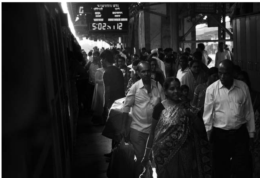
Stazione ferroviaria di Bandra. Qui transitano fino a 40mila persone all'ora.

riguardante gli oppioidi, rapporto che sale a un clinico su 5 nell'ambito dei medici di famiglia 4 . Per indagare se e in quale misura il marketing sia associato al tasso di prescrizione di questi farmaci e questo, a sua volta, alle morti per overdose, un gruppo statunitense di ricercatori spiega sul JAMA Network open di avere preso in esame i dati provenienti da tre database nazionali 5 .