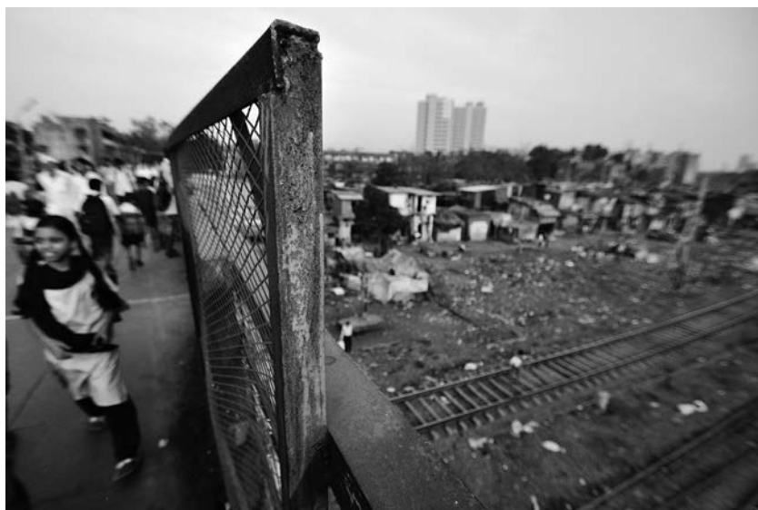
Il ponte che sovrasta la fermata ferroviaria di Mahim Junction. Sullo sfondo inizia già il quartiere di Dahravi.

Negli Stati Uniti le morti causate da overdose da oppioidi rappresentano una vera e propria emergenza sociale 1 . Anche se molti casi sono legati all'abuso di sostanze illecite, l'eroina e il fentanil, non di rado questi decessi sono causati da antidolorifici a base di oppiacei prescritti regolarmente che, inoltre, molto spesso rappresentano il primo contatto con questa classe di sostanze che creano una forte dipendenza; si stima che gli oppioidi prescritti dai medici siano coinvolti nel 40% dei casi di overdose 2,3 . Per questo motivo, negli ultimi tempi media e ricercatori si stanno interrogando su una possibile responsabilità delle attività di marketing farmaceutico dirette agli operatori sanitari: i pagamenti e i benefit legati alla promozione di questi farmaci inducono i medici a prescrivere di più? E questa tendenza si riflette in un numero maggiore di decessi per overdose? Secondo uno studio statunitense, relativo al periodo compreso tra il 2013 e il 2015, in media un medico su 12 è oggetto di marketing farmaceutico