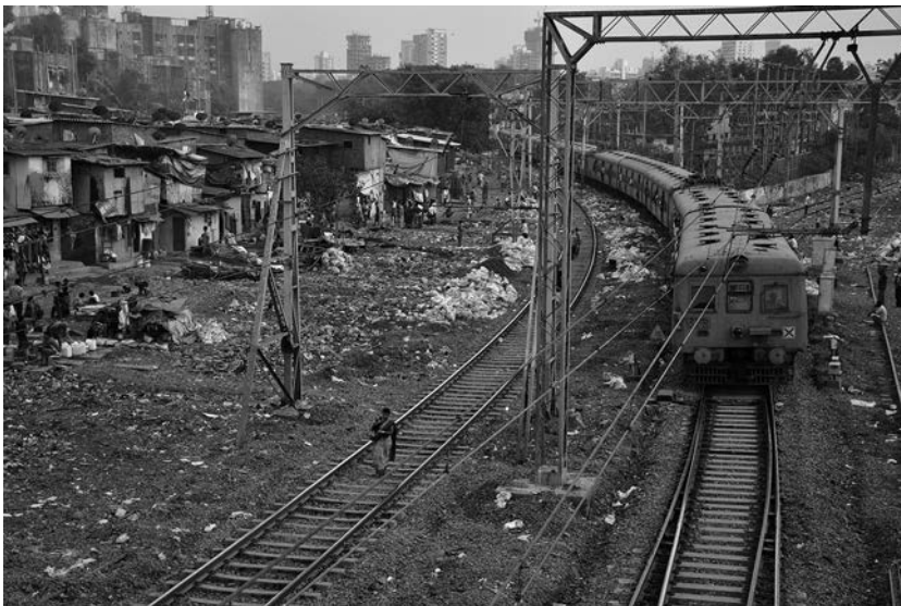
Baracche accatastate a pochi metri dai binari.