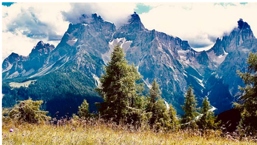
Da Cima Bagni a Croda dei Tuoni.

«Quanto più sfruttiamo le aree marginali tanto più creiamo opportunità di trasmissione», spiega Eric Fèvre 4 , docente di malattie infettive veterinarie dell'Università di Liverpool e ricercatore dell'International Livestock Research Institute. «La scienza dice