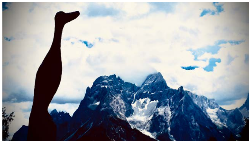
Croda Rossa di Sesto e Cima Undici dalla Baita dell'oca.

Serve investire sulla capacità di sviluppare una forma di pensiero empatico, collettivo, resiliente perché corale. Abbiamo la possibilità di scrollarci il peso di alcuni falsi valori