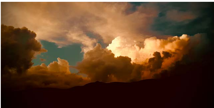
Nuvole sulle Dolomiti.

Dall'analisi portata avanti sembra che possiamo aspettarci che misure di distanziamento fisico e le interruzioni dei supporti e delle attività sociali possano portare a un aumento dei problemi di salute mentale, in misura diversa