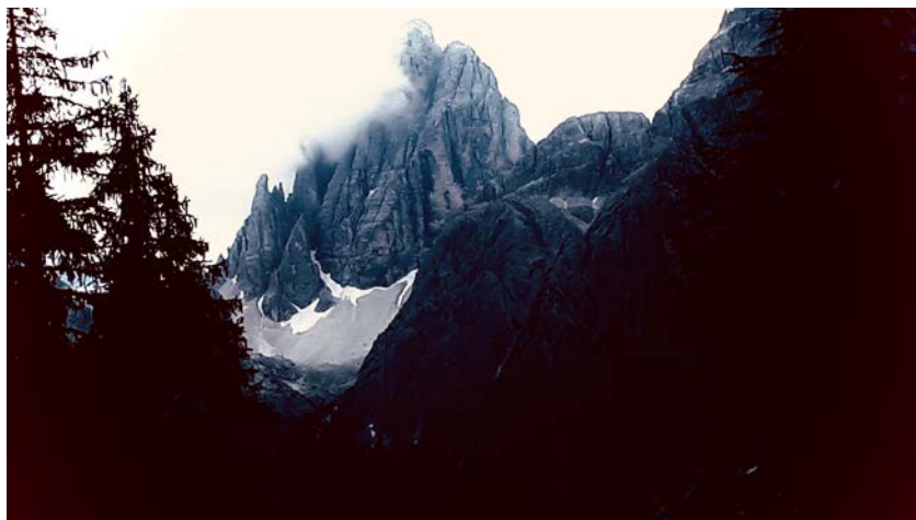
Croda dei Tuoni.