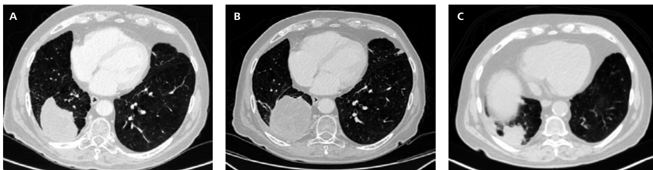
Figura 1. (A) agosto 2019. Diagnosi. La TCTB mostra la lesione a margini spiculati a livello LID; (B) ottobre 2019. Progressione di malattia dopo due cicli di chemioterapia; (C) gennaio 2020. Risposta parziale a trattamento con Crizotinib con marcata riduzione della lesione target polmonare.

La scoperta di mutazioni driver e la possibilità di effettuare profilazioni genomiche complete ha radicalmente cambiato la storia naturale di una quota di neoplasie polmonari, definite "oncogene-addicted". L'introduzione di trattamenti mirati, con TKI specifici in grado di spegnere il segnale di proteine chiave come EGFR, ALK, ROS-1, RET, BRAF, ha permesso infatti di raggiungere sopravvivenze impensabili fino a pochi anni fa. Inoltre l'uso sempre più diffuso