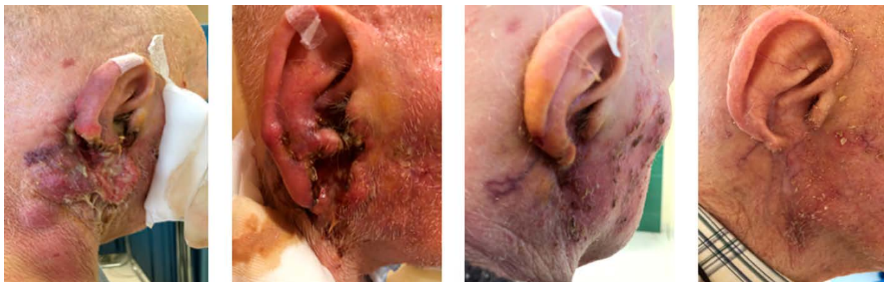
Figura 2. Paziente prima dell'inizio del trattamento con cemiplimab e dopo 1, 5 e 20 somministrazioni del farmaco.