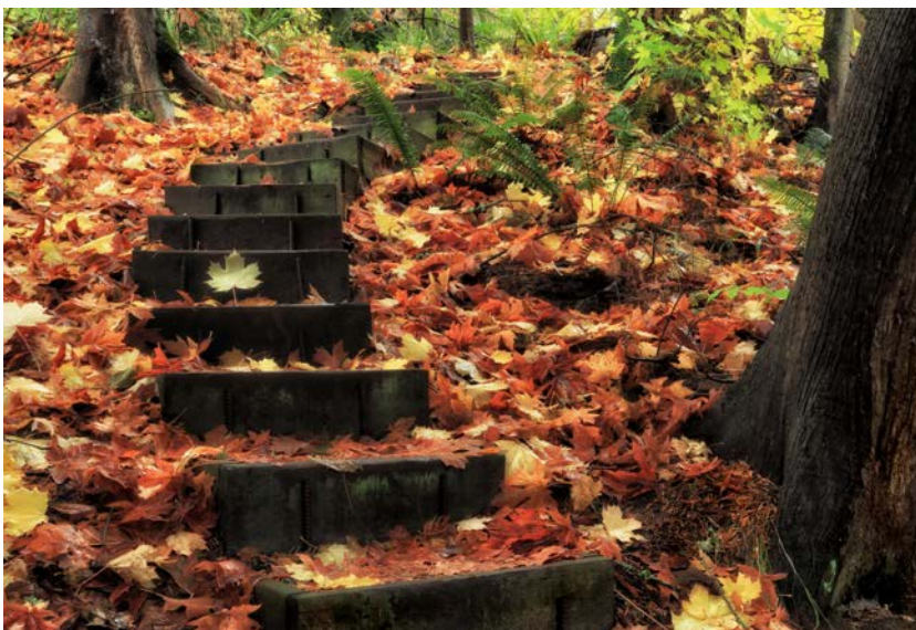
Ian Sane, The last leaf stand .

Dei 37.348 pazienti che hanno ricevuto almeno 1 dei 44 nuovi farmaci orali tra il 2011 e il 2018, 21.324 erano maschi (57,1%); l'età media era di 64,1 (13,1) anni. La maggior parte dei pazienti (36.246 [97,0%]) ha ricevuto farmaci per i quali esistevano prove da studi clinici randomizzati; tutta-