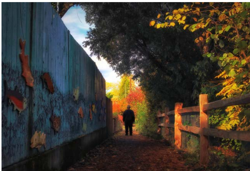
Ian Sane, Autumn perspective .

privilegi l'assistenza portandola fuori dall'ospedale e più vicino alla casa del paziente. «È un appello a cui noi cittadini dell'impero biomedico dovremmo dare ascolto» conclude Horton.