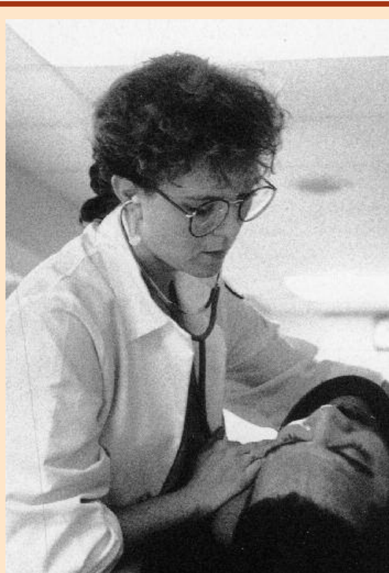
L'assistenza all'Albert Einstein Hospital di Philadelphia (USA), 1991.

La narrazione è una modalità comunicativa flessibile e mirata, che va di volta in volta adattata al paziente reale e alla situazione reale. Non esistono due narrazioni uguali, neanche quando provengono da una stessa persona.