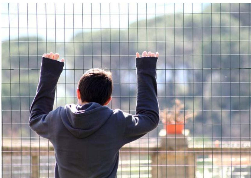
Irene Bonacchi, Fenced in (Flickr - Creative Commons).

completamente vaccinati sia per IMA sia per ictus ischemico. In tutti i sottogruppi è stato osservato un minor rischio di eventi in pazienti completamente vaccinati, sebbene alcuni non abbiano raggiunto la significatività statistica. I risultati supportano dunque la vaccinazione, soprattutto nelle persone con fattori di rischio per malattie cardiovascolari.