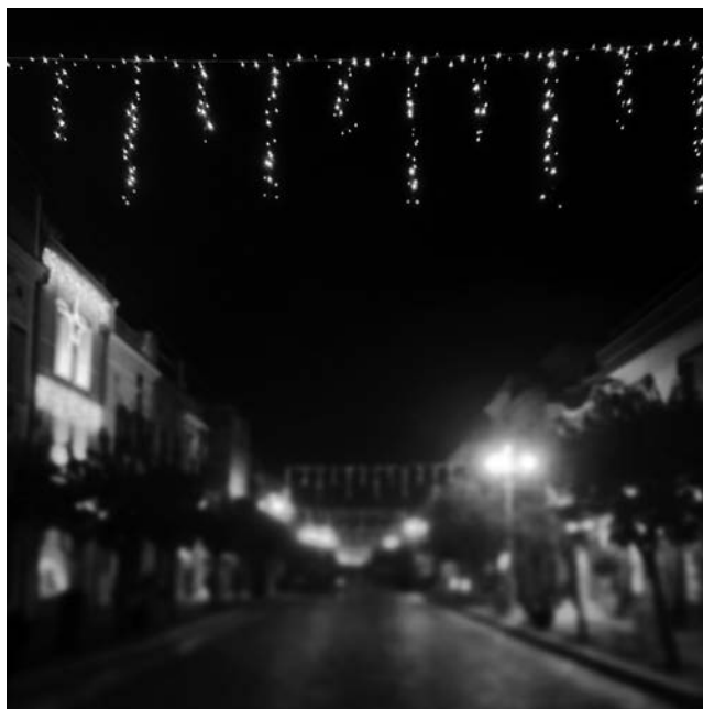
Filena Fortinguerra, Dove ci siamo incontrati.

In conclusione: un altro passo interessante per una ricerca che sta procedendo, con risultati di complessa interpretazione, anche perché molti degli aspetti che condizionano in positivo o