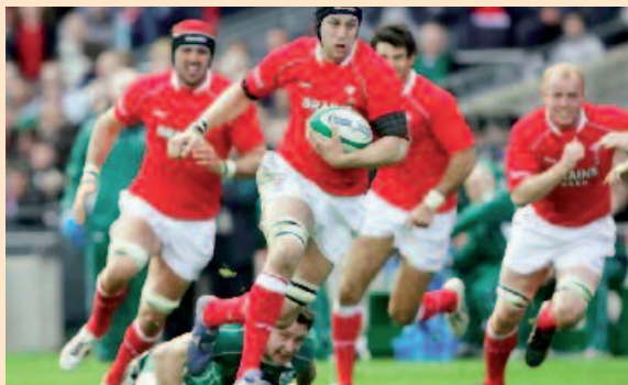
Stando allo studio di Payne GC et al, sarebbe prudente che in Vaticano non si facesse tifo per la vittoria del Galles nel campionato di rugby del Regno Unito.

Da questa ricerca risulta che negli anni recenti (dal 1939 al 1978) la scomparsa di un pontefice si è verificata nell'anno di vittoria del campionato di rugby da parte della squadra del Galles; l'elaborazione statistica dei dati raccolti avrebbe dimostrato un'associazione definita dagli autori "borderline", ma significativa, mentre non avrebbe dimostrato associazione significativa tra morte di un papa e vittoria di un'altra squadra.