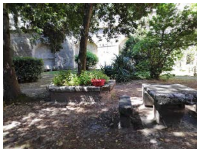
Centro Palazzo Francisci, esterno.

In cucina, anche perché il tavolo da pranzo è in una grande cucina, e mentre tutti cucinano si parla dei massimi sistemi. Cucinare insieme è alla fine un atto d'amore.