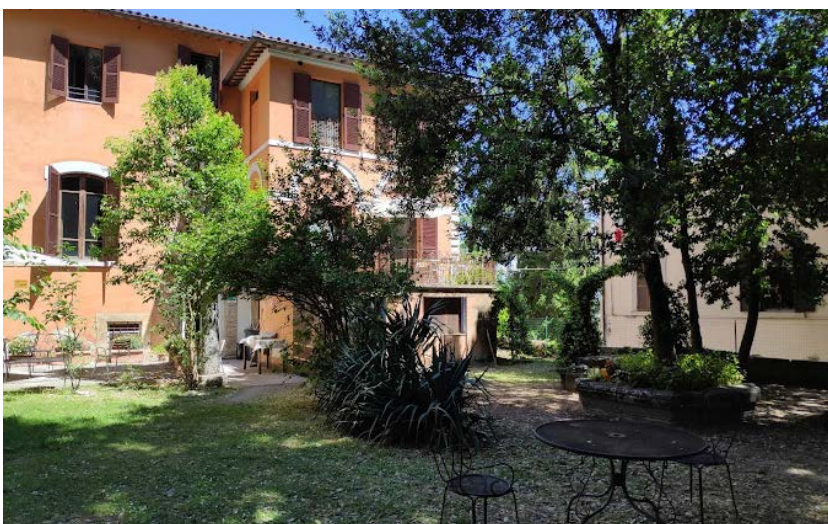
Centro per la cura dei disturbi del comportamento alimentare, Palazzo Francisci, Todi.

Non riesco a immaginare di tenere separata la clinica dalla ricerca, e questo credo debba essere una strada comune. Se si lavora pensando sempre all'innovazione, al miglioramento di ciò che si sta facendo, verrà automatico, cercare di trovare il tempo per fare ricerca, per comunicarla.