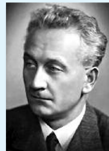
Albert von Szent-Györgyi