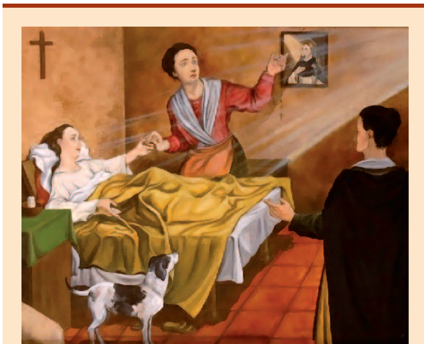
Michele Spinali “Il miracolo della ragazza affetta da calcolosi” Chiesa di San Domenico, Augusta.