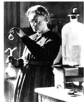
Marie Skłodowska Curie (1867-1934). Premio Nobel 1903 (insieme al marito Pierre Curie) e Premio Nobel 1911 (da sola).

D'altra parte, non è possibile ignorare alcune circostanze - biologiche e biografiche - che possono condizionare le scelte delle carriere femminili: non più tanto barriere dovute a impari opportunità o a discriminazioni pregiudiziali, bensì esigenze familiari, minore disponibilità al lavoro extraorinario, maggiore inclinazione - per quanto riguarda la professione medica - ad aree particolari quali pediatria, microbiologia, neuropsichiatria infantile, genetica ed ostetricia. Però, come sopra accennato, la situazione sta cambiando. Uno studio recentemente apparso sul BMJ ci dice che tra una decina di anni avremo una maggioranza di dottoresse.