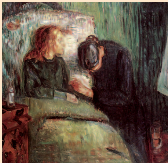
Edward Munch: Il bambino malato.

In conclusione – e non per indulgenza corporativa – non scongiureremo l'acquisizione di questo “Pediatric practice: infectious diseases”; però raccomanderebbe affiancarlo ad altri testi. Lo vedremmo benvenuto in uno scaffale in compagnia di una nuova edizione del Nelson e del “Red Book” dell'American Academy of Pediatrics Committee on Infectious Diseases.