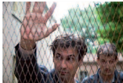
«C'era una volta la città dei matti»: efficace TV movie a ricordo e testimonianza della riforma dell'istituzione psichiatrica voluta ed iniziata da Franco Basaglia.

sociopolitica (sanitaria?) non solo italiana – che un gruppo di operatori, mossi dall'esperienza manicomiale di Gorizia prima, poi di Reggio Emilia e di Trieste, ebbe l'audacia e la pietas di erigere alla negazione della realtà istituzionale, «mettendo in evidenza l'ambigua posizione di una comunità come microsocietà che vuole costituirsi su premesse pratiche e teoriche in opposizione ai valori dominanti» (Franco Basaglia, L'istituzione negata. Rapporto da un ospedale psichiatrico . Giulio Einaudi editore, Torino 1968; pagina 8). La sofferta passione che li animò viene lodevolmente ricordata (commemorata?) in questi giorni (lontani/attuali?) di ricorrenze: la legge 180 che riformò l'intervento psichiatrico (1978), la prematura scomparsa del protagonista (1980). Ed apprezzabile in tal clima – per l'ampiezza di audience e tempestività del messaggio – ne è stata la raffigurazione in una sobria ed efficace fiction televisiva: C'era una volta la città dei matti , diretta con sensibilità partecipe dal regista Marco Turco e interpretata da un Fabrizio Gifuni in una delle sue prove più consonanti. Come ha felicemente commentato Eugenio Borgna (anch'egli profeta e