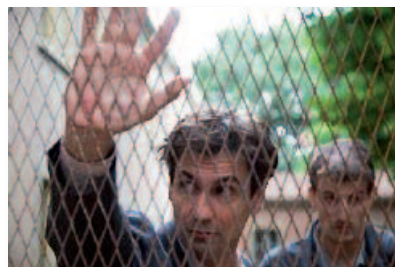
«C'era una volta la città dei matti»: efficace TV movie a ricordo e testimonianza della riforma dell'istituzione psichiatrica voluta ed iniziata da Franco Basaglia.

sociopolitica (sanitaria?) non solo italiana – che un gruppo di operatori, mossi dall'esperienza manicomiale di Gorizia prima, poi di Reggio Emilia e di Trieste, ebbe l'audacia e la pietas di erigere alla negazione della realtà istituzionale, «mettendo in evidenza l'ambigua posizione di una comunità come microsocietà che vuole costituirsi su premesse pratiche e teoriche in opposizione ai valori dominanti» (Franco Basaglia, L'istituzione negata. Rapporto da un ospedale psichiatrico . Giulio Einaudi editore, Torino 1968; pagina 8). La sofferta passione che li animò viene lodevolmente ricordata (commemorata?) in questi giorni (lontani/attuali?) di ricorrenze: la legge 180 che riformò l'intervento psichiatrico (1978), la prematura scomparsa del protagonista (1980). Ed apprezzabile in tal clima – per l'ampiezza di audience e tempestività del messaggio – ne è stata la raffigurazione in una sobria ed efficace fiction televisiva: C'era una volta la città dei matti , diretta con sensibilità partecipe dal regista Marco Turco e interpretata da un Fabrizio Gifuni in una delle sue prove più consonanti. Come ha felicemente commentato Eugenio Borgna (anch'egli profeta e