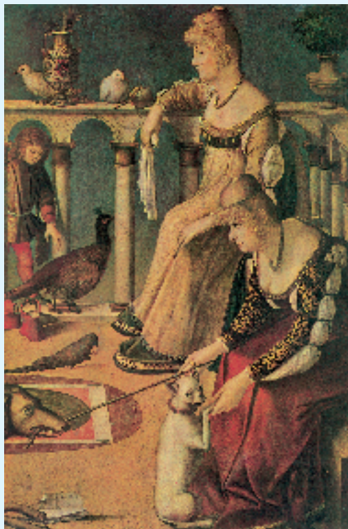
Carpaccio: Le cortigiane (Museo Correr, Venezia)

Desolazione senza nome di un quadro: Le Cortigiane , di Carpaccio. Di dove viene? Ancora un'opera perfetta ottenuta per contrari... Sulla leggiadra terrazza ogni forma di bellezza è raccolta, come in un'immagine araldica: i fiori, i cagnolini, le bianche tortore domestiche, i pavoni dalle code preziose, i melograni più ardenti del rubino. L'aria è calmissima, quasi bronzea nello spessore profondo dell'azzurro. È l'ora immobile, profondamente bella che si vorrebbe arrestare. E 'a che serve?' sembrano gridare in silenzio i due sguardi fissi, di una mitezza senza centro, perduta, i due vuoti e puri profili, uguali come due cose uguali, come due minerali in un trattato, due piante acquatiche: robuste e prigioniere. Ma nei volti delle Cortigiane non c'è giovanile morte né lamento amoroso. Esse non sono che «la profonda storia di un vuoto», dell'orrore ovattato dell'ozio, sbriciolato dal tedio, l'orrore della bellezza inutile, più vuota di una vuota conchiglia. 'Mostri infelici' le chiamò un gentiluomo del loro tempo. Questo ha detto Carpaccio in silenzio: enumerando, ripetendo, mettendo in un angolo, dove nessuno lo vede, un cane atroce e disperato che morde un pezzetto di legno». (Cristina Campo: Gli imperdonabili , Adelphi, Milano 1997).