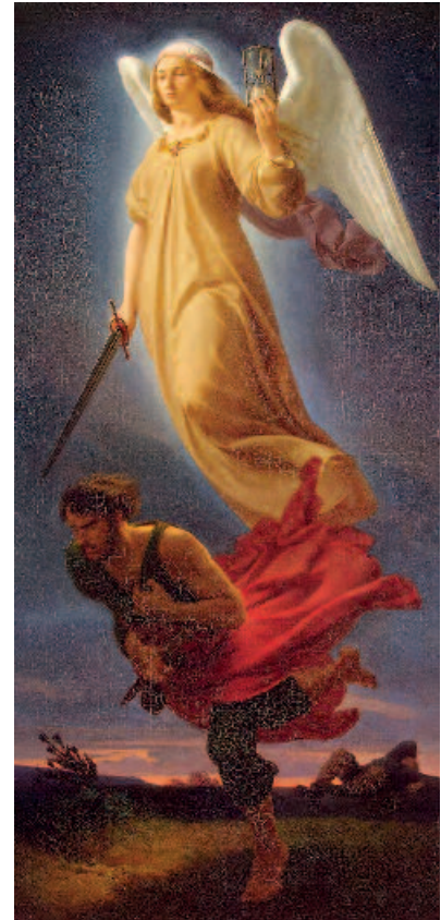
Nemesi, la dea figlia della notte (qui nel dipinto di Alfred Rethel, 1831): malattia-punizione, vindice di colpa presunta, espiazione per maleficio di codardia, eterno conflitto fra desiderio e destino.

Ancora una volta è da sottolineare, in Roth, l'equilibrio tra fascino della narrazione ed universo morale ad essa sotteso. Il titolo di questo romanzo breve, ineccepibilmente costruito per tempi e per scadenze, ci introduce, con determinazione, nella temperie della tragedia greca: il precipitare degli eventi, la disarmata consapevolezza dei personaggi sfidano l'Autore a tessere il filo del suo incandescente confronto con il fato. («... La sua rabbia non era rivolta contro il virus della polio, ma contro la fonte, contro il Dio che aveva creato il virus», pagina 82). Si avvertono echi de «La peste» di Camus e de «La morte a Venezia», così come,