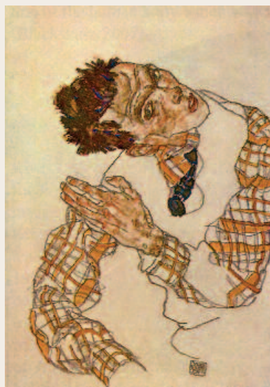
Egon Schiele: Autoritratto

sostenuti da pittori, letterati, compositori, talvolta senza successo (accadde a Schumann, Šostakovič, Pascal) e altre volte pervenendo ad una paradossale integrazione creativa tra patologia ed ispirazione artistica (fu il caso di Klee e di Ramuz). Viene anche ricordato come possano essere gli stessi artisti i primi diagnostici dei propri disturbi: Stendhal denunciò e descrisse i frequenti attacchi ischemici transitori che precedettero l' ictus a lui fatale. Per contro, è bene smentire ipotesi che non hanno fondamento, quale, ad esempio, il supposto trigger creativo provocato in De Chirico dall'aura emicranica e dalle crisi epilettiche: correlazione mai dimostrata.