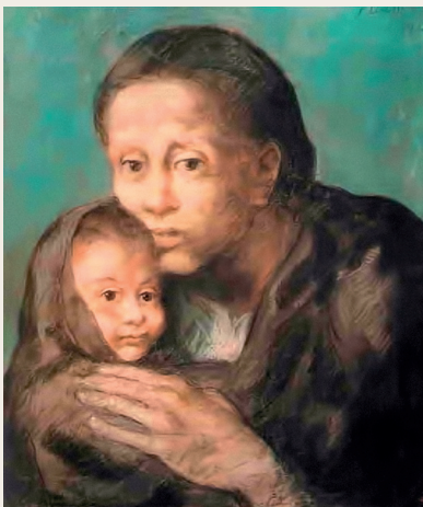
Pablo Picasso. Madre con bambino malato. Pastello su carta, Barcellona, Museo Picasso

Sulla scia di tale intento di ammodernamento, il DVD allegato alle precedenti edizioni non poteva non cedere il passo alla più versatile e attuale gamma di ausili web. Agli acquirenti sarà, infatti, sufficiente registrarsi sul sito dell’Editore attivando il codice che correda la loro copia del libro, per ottenere accesso ad un opulentissimo web di ulteriori informazioni, chiarimenti e dettagli, particolarmente utili a chi abbia necessità di approfondire le conoscenze su non poche aree iperspecialistiche: quali, ad esempio, la ventilazione respiratoria del bambino, la cardiopatia pediatrica, l’anestesia regionale. Pure le appendici non si trovano nella copia cartacea: sono disponibili online. Includendo sia una sinossi di farmacoterapia pediatrica con notizie preziosamente esaustive (indicazioni, dosaggi, effetti collaterali), sia un indice delle sindromi che comportano interventi di anestesia, es-